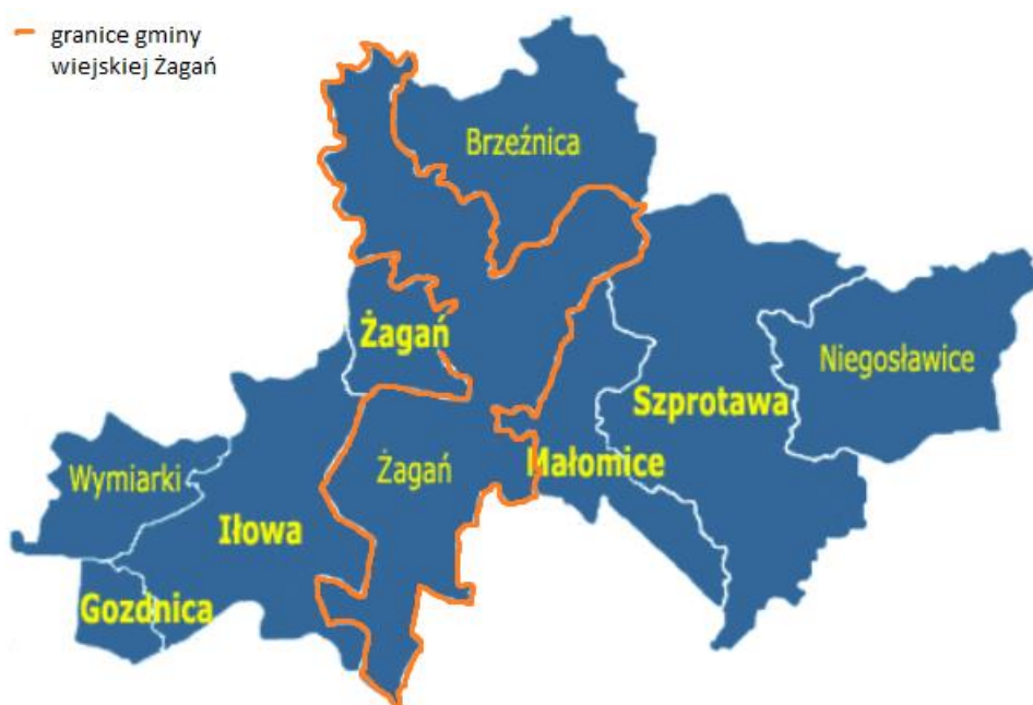
Rys. 1 Położenie gminy Żagań na tle powiatu żagańskiego.

Gmina Żagań leży w południowej części województwa lubuskiego, w centralnej części powiatu żagańskiego, dzieląc go niejako na dwie części. Od ośrodków wojewódzkich Żagań - miasto będące jednocześnie siedzibą gminy wiejskiej, oddalony jest o: 160 km -od Gorzowa Wielkopolskiego i o niecałe 50 km od Zielonej Góry. Gmina Żagań graniczy z gminami: Nowogród Bobrzański (od północy), Brzeźnica, Szprotawa, Małomice (od wschodu), Osiecznica (od południa - gmina z województwa dolnośląskiego) oraz Iłowa i Żary (od zachodu).